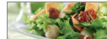
Frisches erwartet Sie im Culinaria