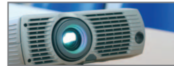
Ausstattung mit modernster Technik