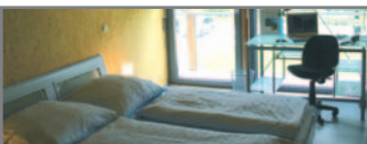
Doppelzimmer mit Waldblick