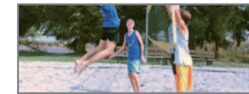
Sommerspaß beim Beach-Volleyball