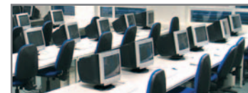
EDV-Raum mit 15 PC-Arbeitsplätzen