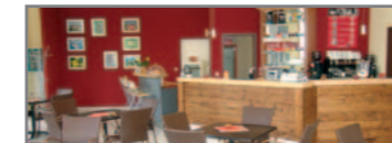
Nette Gespräche im College-Café