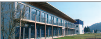
Tagungshotel Vicinty auf dem Campus

Der Umwelt-Campus Birkenfeld ist ein ganz besonderer Ort. Die Campus Company GmbH gestaltet gemeinsam mit der Fachhochschule ein reges Campusleben. Unter den Vorzeichen von Umwelt und Nachhaltigkeit wird hier gelernt und gelehrt, gelebt und gearbeitet.