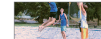
Sommerspaß beim Beach-Volleyball